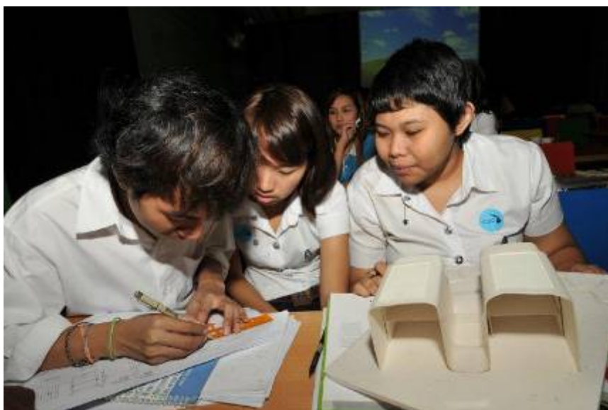
设计会参赛学生们正在认真工作。