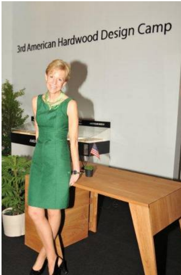
美国驻泰大使 H.E. Kristie A. Kenney 在使用美国硬木设计的作品前留影。