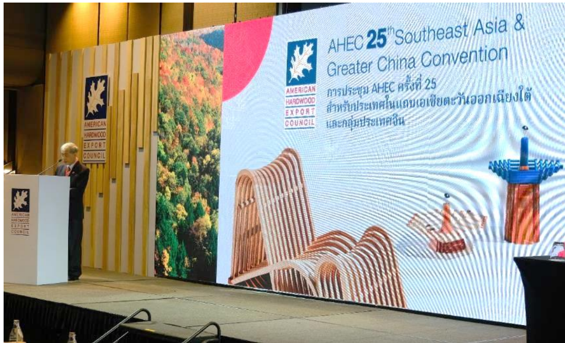
第二十五屆美國闊葉木外銷委員會（AHEC）東南亞及大中華年會在曼谷萬豪侯爵酒店順利召開

（2022 年 10 月 – 曼谷訊）第二十五屆美國闊葉木外銷委員會（AHEC）東南亞及大中華年會於 10 月 14 日在曼谷萬豪侯爵酒店順利召開，東南亞木材行業極具影響力的專業人士濟濟一堂，聆聽專家演講，並展開討論和交流。AHEC 年會歷來是行業公認的洞察全球木材貿易風向的重要平台，也為建筑设计行業人士建立和發展互惠互利的商業聯系創造更多機會。